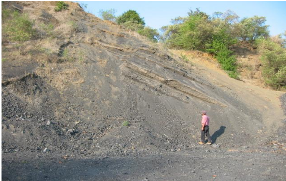
Tajo de agregados pétreos de la localidad Paracho Viejo I, en el que se muestra la acumulación de material piroclástico en forma de capas sucesivas ligeramente inclinadas.

Nota: Para mayor información consulte la página web del Servicio Geológico Mexicano www.sgm.gob.mx , iconos archivo técnico/ inventarios mineros/ estado/ municipio.